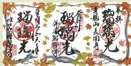
左：温泉寺/中：佛法紹隆寺/右：長圓寺

お殿様の参詣仏である「薬師瑠璃光如来」。各寺院、デザインの異なる台紙の期間限定御朱印をご用意しました。三ヶ寺をめぐり全て集めると一枚の絵になる仕様です。